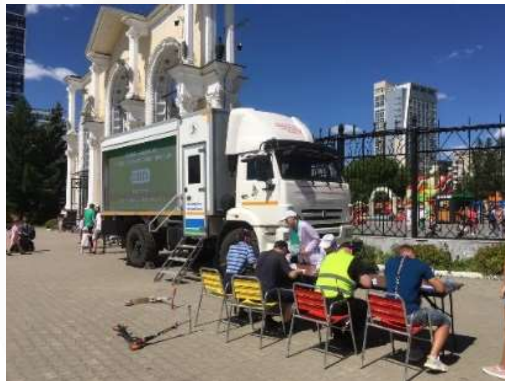
Мобильный пункт диспансеризации в Центральном Парке культуры и отдыха им. В.В. Маяковского