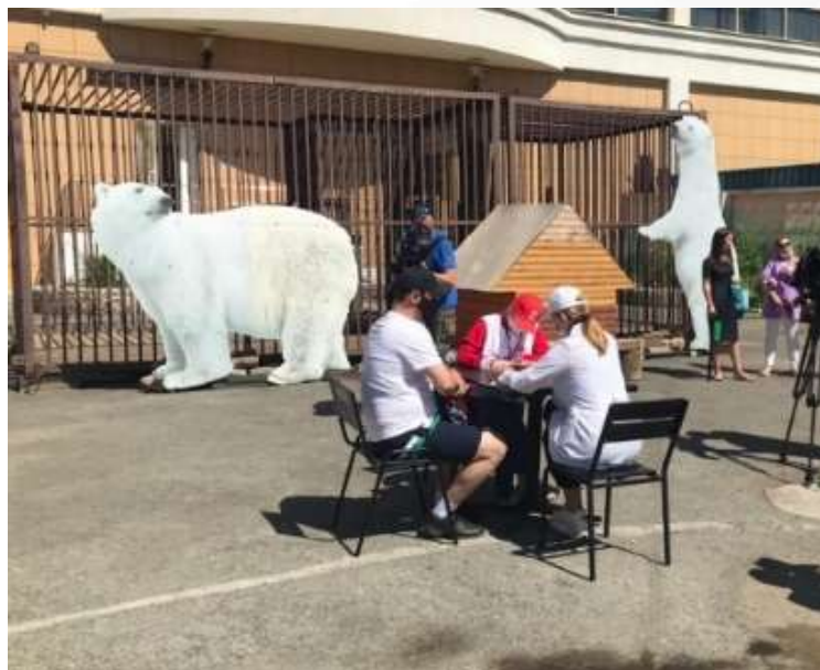
Пункт вакцинации в Екатеринбургском зоопарке