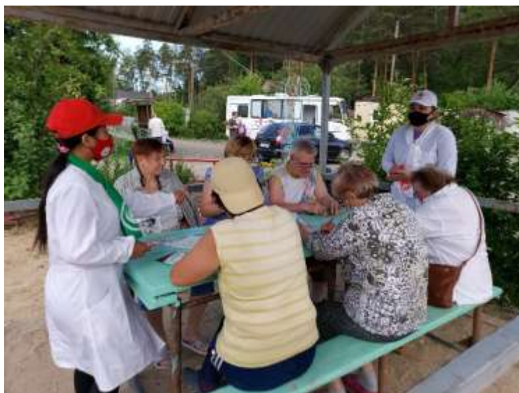
Пункт вакцинации от COVID-19 в садовом некоммерческом товариществе «Луч»