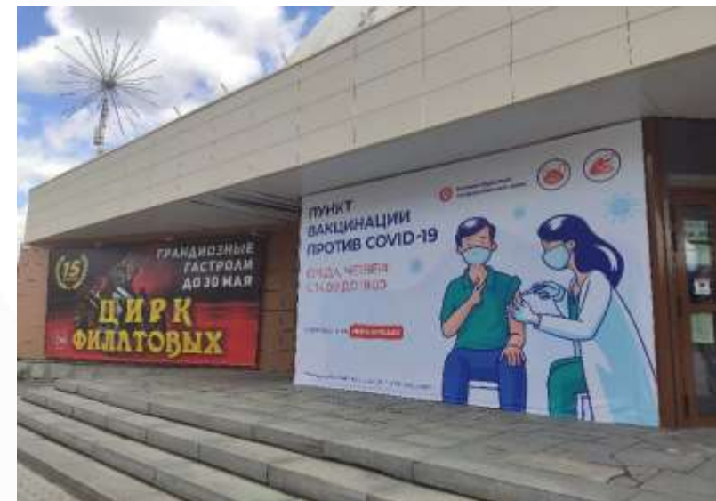
Пункт вакцинации от COVID-19 в Екатеринбургском государственном цирке имени В. И. Филатова