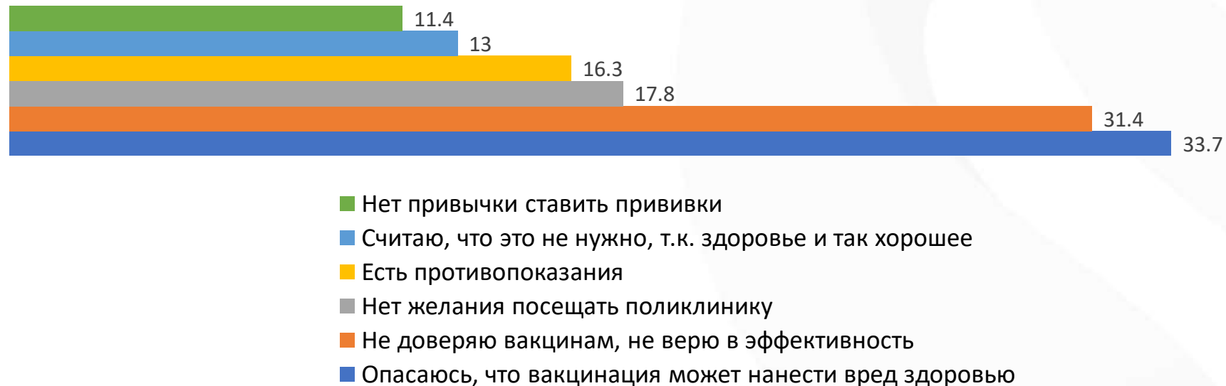
Причины, по которым не вакцинируются от Гриппа

«Отношение родителей несовершеннолетних детей к вакцинации против Гриппа» онлайн-опрос родителей несовершеннолетних детей, проживающих на территории Свердловской области. Опрос проводился через тематические чаты, средний возраст опрошенных 39 лет, 95% женщины, 4883 респондента, 2021 г. Распределение ответов респондентов, не привившихся и не планирующих прививаться в текущем году (59,2% от общего числа опрошенных).