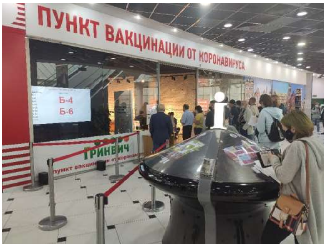
Пункт вакцинации от COVID-19 в торгово-развлекательном центре «Гринвич»